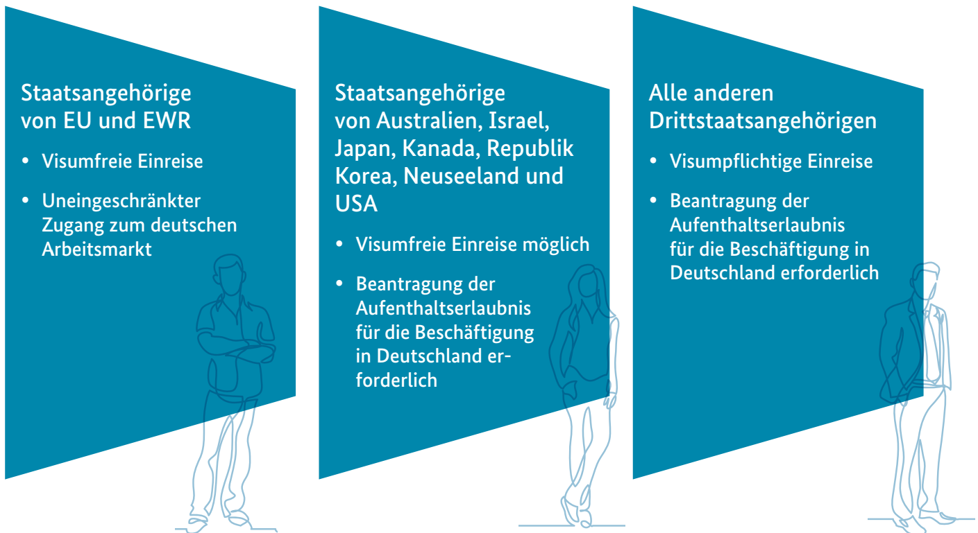
Abbildung 1: Zugang zum Arbeitsmarkt - Wer braucht ein Visum?

Die Bundesrepublik Deutschland hat, was die Einreise und den Zuzug von Fachkräften betrifft, mit einigen Staaten besondere Abkommen, die eine visumfreie Einreise ermöglichen. Für alle anderen gelten je nach Einreisezweck unterschiedliche Visaregelungen.